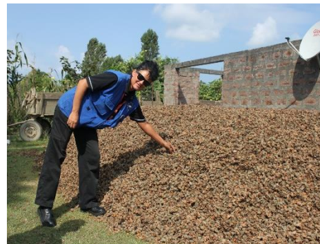
ყოველწლიურად ზაფხულიდან შემოდგომის ჩათვლით ათობით ათასი ტონა თხილი იკრივება.

პირობითი პრაქტიკა აფხაზეთში გადამსვლელებს შეუძლიათ საქონელი გადაიტანონ, მაგრამ ხშირად, დიდი რაოდენობის საქონლის არსებობისას, არის მოთხოვნა, რომ მათ იმპორტის მოსაკრებელი გადაიხადონ. აფხაზეთის დე-ფაქტო მესაზღვრეების მიერ აღებული საბაჟო გადასახადები და ექსპორტის მოსაკრებელი სეზონისა და სხვა ფაქტორების მიხედვით განსხვავდება.