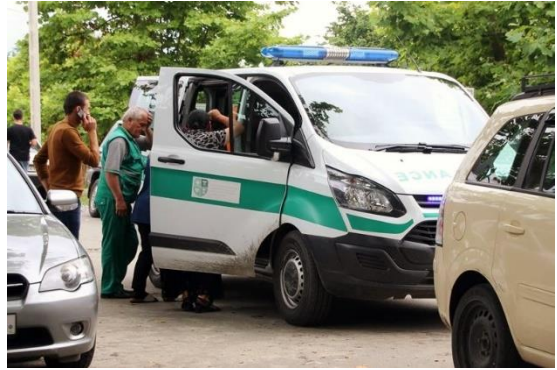
სასწრაფო დახმარების მანქანას თბილისის მიერ ადმინისტრირებული ტერიტორიიდან ნაბაკევი / ხურჩის კონტროლირებადი გადაკვეთის პუნქტში აჰყავს პაციენტი აფხაზეთიდან სამედიცინო მიზნით გადაკვეთის შემდეგ.