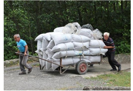
ყოველწლიურად ახლად მოკრევილი თხილი თხილის მეურნეობებიდან უფრო მაღალი გადახდის ბაზრებზე გადადის.

თხილი - მრავალი მილიარდი ევროს ღირებულების ინდუსტრია საქართველო მდებარეობს ისეთ კლიმატურ ზონაში, სადაც არის ხელსაყრელი პირობები თხილის მოსაყვანად შავი ზღვის სანაპიროზე. თხილის მოყვანა არის დიდი ბიზნესი საქართველოში, ამ საქმეში ჩართული ათასობით ფერმერი დამოკიდებულია მსოფლიო ბაზრის ფასებზე. სავარაუდოდ, მოთხოვნა გაიზრდება, ხოლო გრძელვადიან პერსპექტივაში საქართველოს აქვს კარგი შანსი, გახდეს მსოფლიოში თხილის მომწოდებელი 3 მთავარი ქვეყნიდან ერთ-ერთი თურქეთისა და იტალიის შემდეგ. საქართველოს თხილის წლიური წარმოების 37,000 ტონა (2014) უმეტესი ნაწილი მიდის საკონდიტრო საწარმოებში, სადაც უდიდესი წილი იტალიურ ფერეროს (Ferrero) აქვს. ფერერო თავისი ცნობილი ნუტელას (Nutella) და ფერერო როშეს (Ferrero Rocher) საწარმოებლად მსოფლიოს თხილის მიწოდების ¼ ყიდულობს.