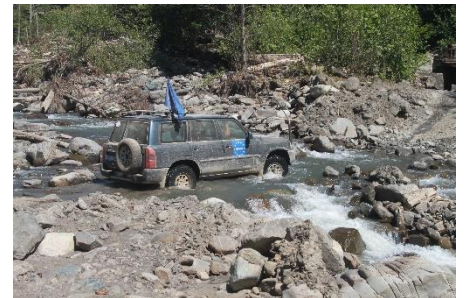
ევროკავშირის სადამკვირვებლო მისიის ზუგდიდის რეგიონალური ოფისის დამკვირვებლები პატრულირებაზე პასუხისმგებლობის ზონის ჩრდილოეთ ყველაზე შორს მდებარე მთიან ნაწილში.

ევროპის მეორე უმაღლესი მწვერვალი დასავლეთ საქართველოში მდებარე 5,201 მ. სიმაღლის მთა შხარა, რომელიც არის ყველაზე მაღალი მთა საქართველოში და სიმაღლით მეორე ევროპაში, რუსეთში მდებარე იალბუზის (5,642 მ) შემდეგ წინ უსწრებს მონბლანს, უმაღლეს მთას დასავლეთ ევროპაში (4,810 მ).