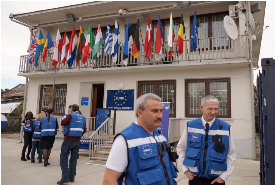
2008 წლის შობის დღესასწაულის შემდეგ ზუგდიდის რეგიონალური ოფისი მეუნარგას ქუჩაზე გახდა ევროკავშირის სადამკვირვებლო მისიის სახლი დასავლეთ საქართველოში.