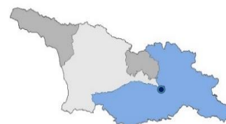
С точки зрения численности персонала Полевой Офис в Мцхета является наименьшим из трех Полевых Офисов Миссии, но имеет наибольшую зону ответственности (синий).

Ахалцихе на юго-западе через Мцхета и Тбилиси до Рустави и Азербайджана на юго-востоке до Каспийского моря. В Самцхе-Джавахеги и Шида Картли на юге имеются крупные поселения этнических армян и азербайджанцев. Большинство осетин живут в Южной Осетии, в которой также отмечается значительное российское военное присутствие.