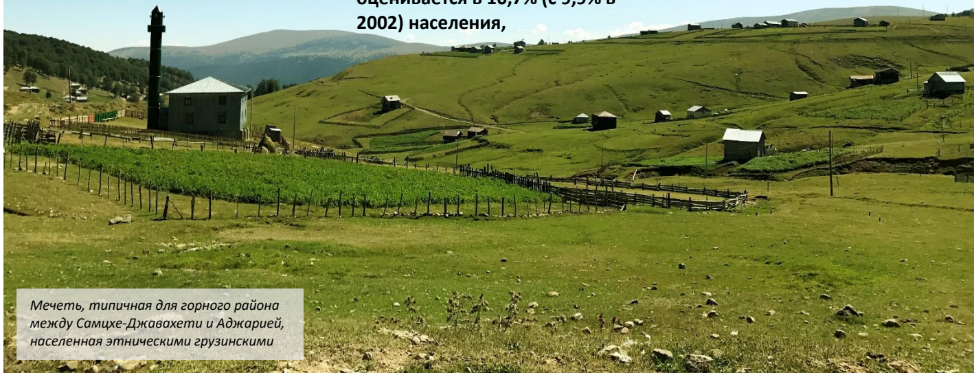
Мечеть, типичная для горного района между Самцхе-Джавахети и Аджарией, населенная этническими грузинскими

Эта группа составляет 43% населения в Квемо Картли, 40% в Аджарии и 12% в Кахети. Кроме того, в Грузии насчитывается около 19 000 католиков, 12 400 свидетелей Иеговы, 8 600 езидов, 2500 протестантов и 1400 приверженцев иудаизма.