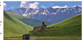
Members from Field Office Mtskheta preparing to depart for a patrol in the Administrative Boundary Line area near the village of L. B. Gori.

The Field Office monitors the eastern section of the South Ossetian Administrative Boundary Line including the Controlled Crossing Point in Odzha (see page 3). The impact on the conflict-affected population on both sides of the Administrative Boundary Line, including the large number of internally Displaced Persons, is a particular focus for the Field Office (see page 3). As part of this work, the Field Office monitors how ethnic and religious minorities are affected and how this may have an impact on the stability in the country.