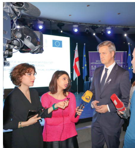
Қырттәыла икоу ЕАНМ ахада Ерик Хег, ацеремониа иалагаанза, атыгәнтәи ателееилахәырақәа рхатәрнакцәа Агхыахә Хада иазкны драцәажәоит, 2017 шықәса, гүхынцкәын

Аинцидентқәа рпревенциеи рықәғытреи амеханизм ағапхыа ауадафрақәа рацәоуп, аха уи абзоуралоуп аганқәа ашәартәдара иазку актуалтә темақәа рылацәажәара алшара шрымоу. Алцшәа бзиа ахылцит Ацәахәа шы аусурагы, уи ЕА Анапшцәа Рмиссия ацхыраара ала аус әуеит. Ацәахәа шы аусура иалагоит аинцидентқәа раан, мамзаргы атышәынтәалареи административтә аҳәақәа рғы инхо ауаа рыгүстазаареи аганахыала шәартәк аңцәыртцау. Еакала иахәозар, уи ател ала аибарххара аитәтәразы ахәархәага бзиоуп. Инеизакны иуәозар, Амиссия атыгәағы икоуп, еигүкырада атагылазаашыа иацклагшүеит, аҳасабырба цәырыргоит, ақәғытра иазыхиоуп, аимадареи адиалоги иацхраауеит - Амиссия актуалтә цакы амоуп, уи хымгәада атыгәағы иказароуп ашәартәдара аганахыала атагылазаашыа ахылапшыразы.