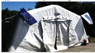
IPRM meetings were established in 2005, following an agreement reached during the Geneva International Discussions.

The Incident Prevention and Response Mechanism (IPRM) meetings allow participants from both sides of the Administrative Boundary Lines to talk to one another about security issues and other matters that affect people living along the lines.