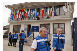
The EUMM has three fully staffed Field Offices in Georgia. These are the bases from where operations are conducted where cooperation with partners and interlocutors is coordinated.

In Eastern Georgia Mtskheta and Gori Field Office cover the activities inland and along the Administrative Boundary Line with South Ossetia. In the eastern corner of the country, Field Office Zugdidi covers the line and both of the entire Western Georgia. This is the real field office, 'gate' not least because of its remote location to the capital, a road to the capital Tbilisi takes 6 hours.